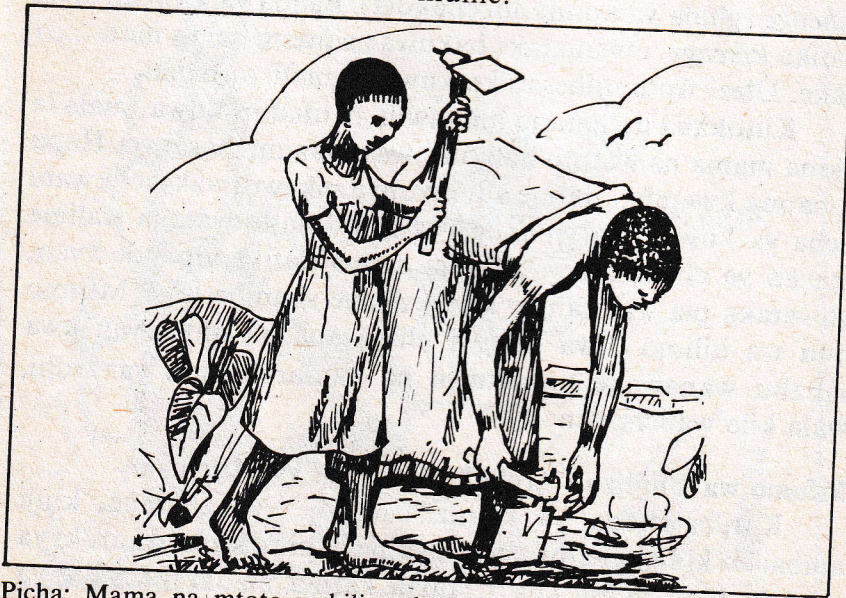
Picha: Mama na mtoto wakilima kwenye shamba wakitumia vijembe vidogo.

Familia ya Kisambaa ilikuwa na baba ambaye ndiye aliyekuwa kiongozi wa nyumba, mke (au wake) na watoto. Familia au jamii ilikuwa na aina mbili za ardhi. Kwanza, ardhi ya baba ambayo ilikuwa yake mwenyewe. Pili, ardhi ya wanawake ambayo walikatiwa vipande. Wake wa mtu walifanya kazi katika vipande vya mashamba siyo kama mali yao, bali kama mahali pa kuweza kulima na kujipatia mazao ya chakula kwa kulisha familia nzima na jamaa waliowatembelea. Baba wa nyumba, alikuwa na madaraka ya kupangua utaratibu wa vipande vilivyokatwa, hasa pale alipoamua kuo a mke mwingine. Kawaida wake walitumia vipande vya ardhi walivyokatiwa kuvisimamia kama mali ya baadaye ya watoto wao wa kiume.