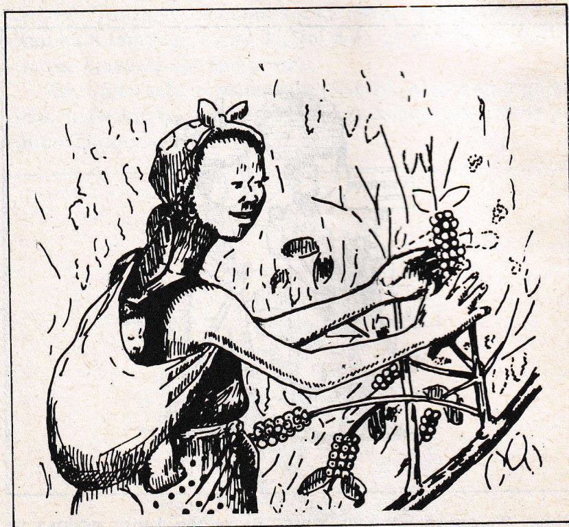
Picha: Mkulima kwenye shamba la kahawa.

Katika vijiji vya Tanzania ardhi ndiyo msingi wa uzalishaji mali. Kabla ya kufika kwa wakoloni, babu zetu walijitegemea kwa mazao ya chakula kwa kutumia ardhi. Wakoloni walipofika walitumia ardhi yetu kupata utajiri mkubwa kutokana na mazao ya biashara (pamba, katani, kahawa, karanga na chai). Wakati wa ukoloni haki ya kumiliki ardhi ndiyo ilimpa mtu haki ya kuwa mwanachama katika vyama vya wakulima, kupata mikopo, hata haki ya kutumia mifereji kwa kumwagilia mashamba.