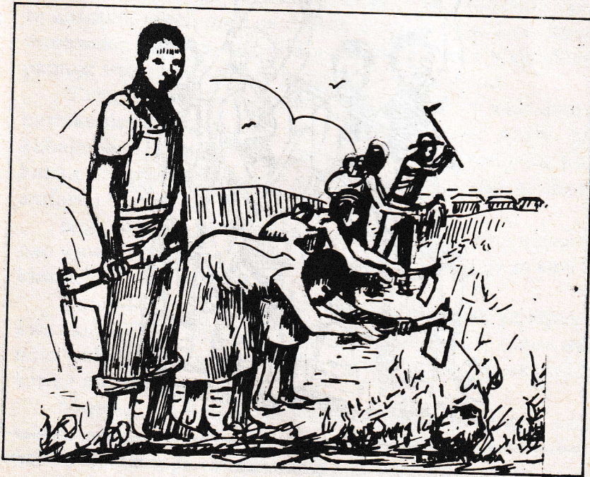
Picha: Wanakijiji, wake kwa waume, wakilima kwenye shamba la kijiji.

Tatu, kuna mashamba ya bega kwa bega ambayo chini ya utaratibu wa mashamba hayo, hugawiwa kwa kila mtu. Kila mwanakijiji hukatiwa shamba lisilopungua ekari moja. Kila mtu anawajibika kutunza shamba lake na kuhakikisha kwamba kila mwaka linalimwa. Mavuno yatokanayo na shamba la bega kwa bega humilikiwa na mwenye shamba.