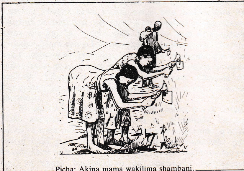
Picha: Akina mama wakilima shambani.

Tatu, kwa sababu wanawake hushiriki bega kwa bega na akina baba vijijini katika jitihada za kuleta mapinduzi ya kilimo Tanzania.