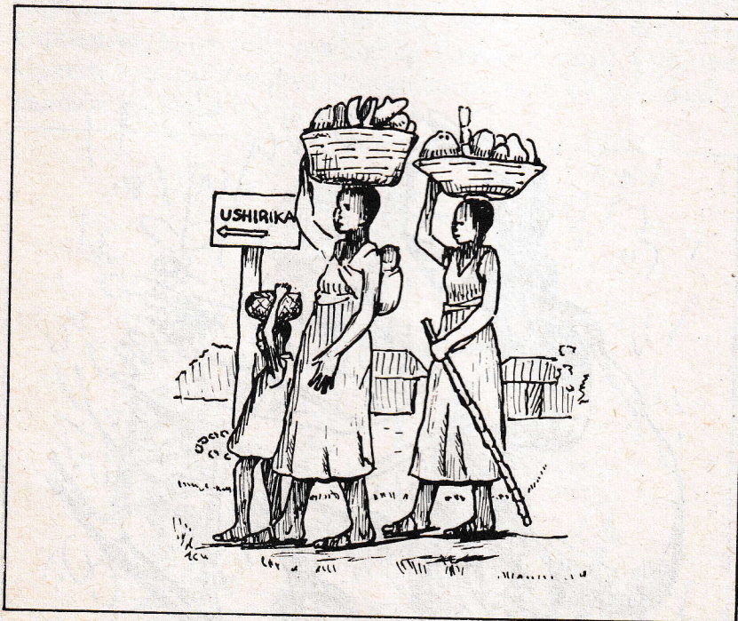
Picha: Wanawake wakienda kuuza mazao yao katika ushirika wa wakulima.

Pamoja na kutetea haki hii, wanawake watetea haki ya kumiliki mazao wanayolima, zana za kilimo, kuwa wanachama wa ushirika wa wakulima na kupata mikopo itakayowawezesha kuendeleza kilimo. Kumiliki au kujenga nyumba, kufuga na kumiliki mifugo.