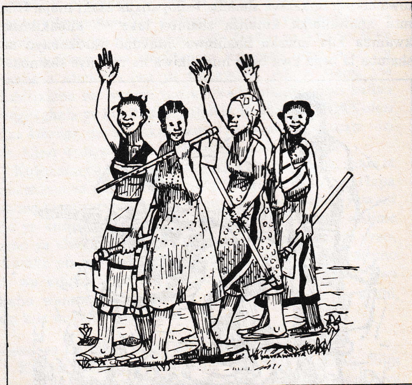
Picha: Wanawake wakiwa wamebeba majembe mabegani huku wakiimba wakiwa wameinua mikono juu.