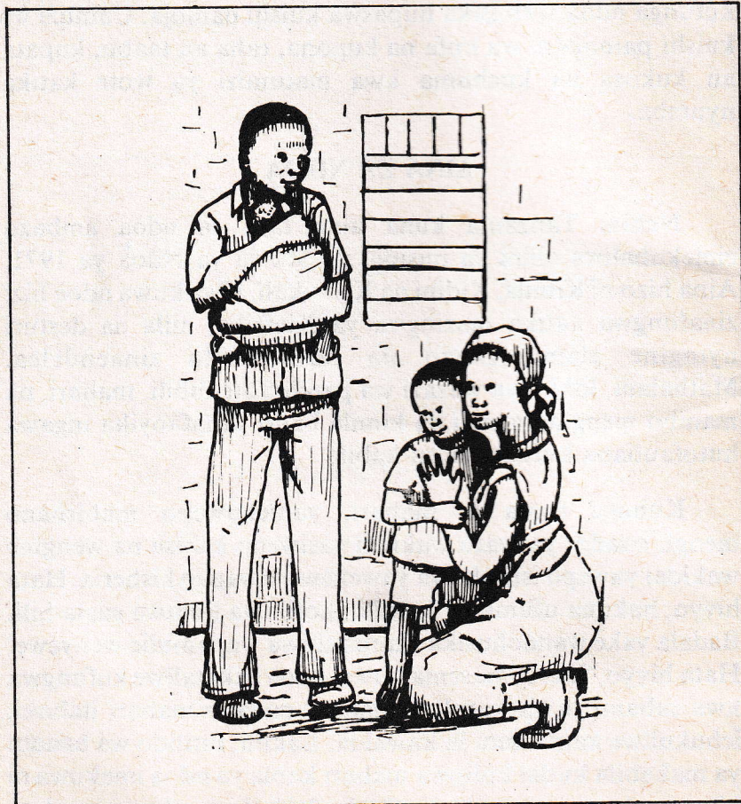
Wazazi ni walezi wa familia.

makubwa baadaye. Matarajio yao ni kushirikiana kwa kila wanachokipata au kuchuma, kusaidiana shida zinapotokea na kuyakabili matatizo ya wazazi wa pande zote mbili. Pia inawabidi wajiandae kupokea familia yao pindi watakapojaliwa kupata watoto na kuwatunza watoto hawa kwa imani na upendo.