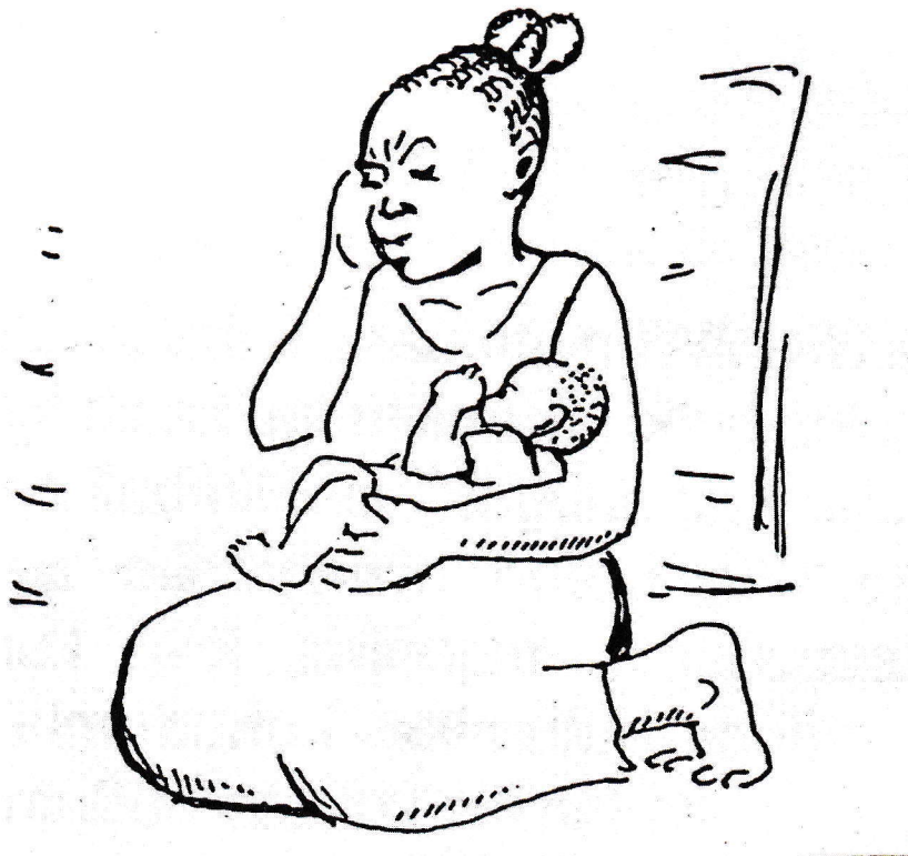
Kielelezo: Msichana mdogo akinyonyesha mtoto

Baadhi ya makabila watoto huolewa wakiwa na umri mdogo ili wazazi waweze kupata fedha au mifugo kutoka kwa waoaji. Watoto wengi wameolewa na watu wazima wenye umri mkubwa, na hivyo kusababisha mimba za utotoni na kusababisha wengi wao kupoteza maisha. Huu ni ukatili wa kijinsia kwani wasichana wanaozeshwa bila ridhaa yao kwa watu wasiokuwa na mapenzi nao.