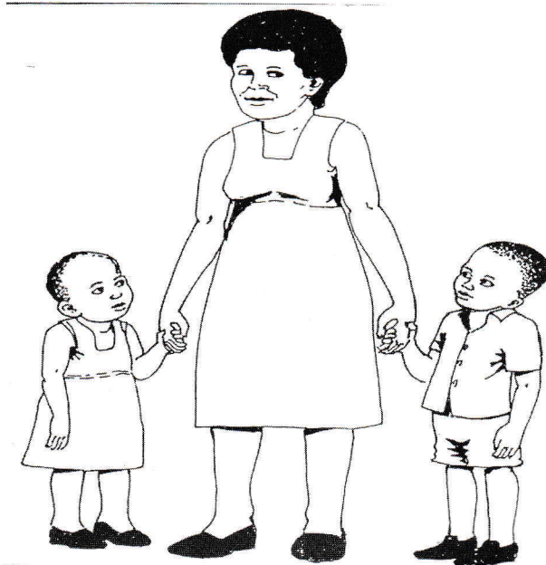
Kielelezo: mama akiwa na watoto wake

Mwanamke anao wajibu mkubwa kwa familia na jamii kwa vile yeye ndiye anayebeba na kulea mimba hadi mtoto anapozaliwa. Hivyo hana budi kujitahidi kupambana na unyanyasaji wa kijinsia ambao unaweza kumwathiri yeye pamoja na familia yake. Asipopambana matokeo yake atakosa haki yake na haki ya familia na hivyo kuwa masikini.